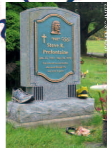
▮ Grab und Todesstelle von Steve Prefontaine. Beide Orte gelten als Pilgerstätte seiner Fans und werden reichlich mit Laufutensilien bedacht.