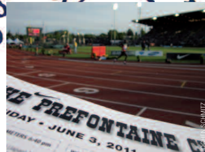
▮ Die Prefontaine Classic werden im Hayward-Field-Stadion ausgetragen. Der Läufer im Hintergrund ist Weltrekordler Moses Mosop.