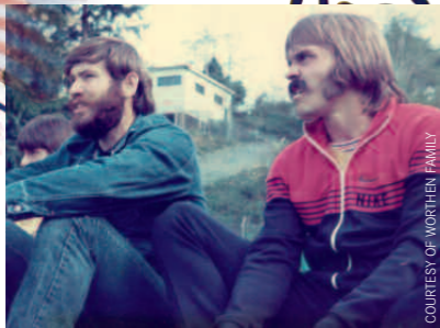
▮ Prefontaine 1975 während einer Pause bei einem der Marshfield Meets. Es war sein letzter Wettkampf in diesem Stadion vor seinem Tod.