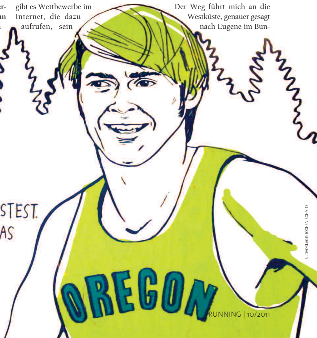
BILDVORLAGE: JOCHEN SCHMITZ

MOST PEOPLE RACE TO SEE WHO IS THE FASTEST. I RACE TO SEE WHO HAS THE MOST GUTS.