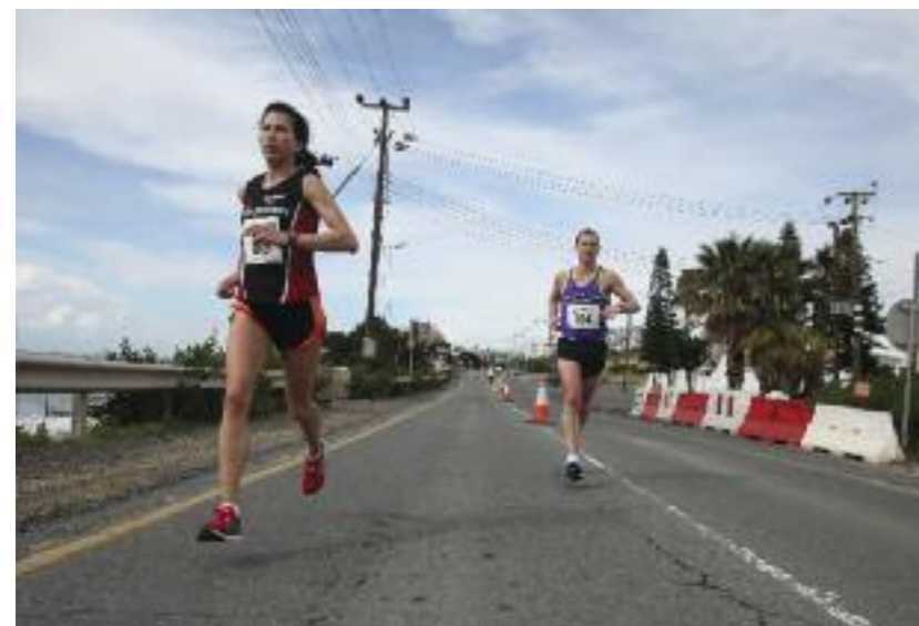
► Bild links: Zwei Teilnehmer im schnellen Gleichschritt bei frühlingshaften Temperaturen