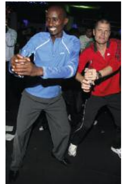
► Tanzende schnelle Männer bei der After-Run-Party mit möglicherweise alkoholfreien isotonischen Durstlöschern

ordentlichen Zeiten und ließen sich vom Seewind, der ihnen auf Teilstrecken entgegenwehte, nicht bremsen. Wenn also am 20.02.2011 der fünfte Limassol Marathon losgeschossen wird, dürften nach Lage der Dinge deutlich mehr als die 479 Starter von 2010 über die zehn Kilometer, Halb- und Marathondistanz an den Start gehen und guten Zeiten nachjagen. Wenn Sie, lieber RUNNING-Leser, darüber nachdenken dabei zu sein, wissen Sie ja jetzt so ungefähr, was sie erwartet.