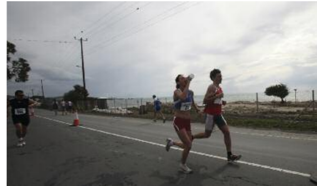
► Flüssigkeitsaufnahme vor dem anstrengenden zweiten Teil der Laufstrecke

entgegen und die Teilnahme an einer Meze-Mahlzeit sollte obligatorisch sein. Was dabei dann noch musikalisch geboten wird, entspringt ganz der jeweiligen Situation und der Eigeninitiative der Gäste der Tafel. Die historischen Stätten und Ausflüge in den türkischen Teil der Insel lassen auch die kulturbeflissenen Sportreisenden auf ihre Kosten kommen.