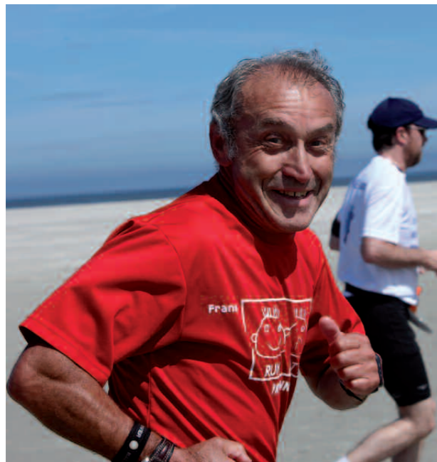
► Wer so viel Spaß beim Sport haben will ...

Der Nordseelauf mit seiner ganz besonderen Atmosphäre ist ein Unikum im Sportuniversum, zu dem vor einigen Jahren sogar schon eine Läufergruppe extra aus den USA angereist ist. Er funktioniert nur, weil alle Beteiligten nicht nur ihren Job machen, sondern mit viel Herzblut und Leidenschaft dabei sind. Vom 09. bis 16.06.2012 geht es beim nächsten 11. EWE-Nordseelauf über alle sieben ostfriesischen Inseln und durchs Watt von Neuwerk nach Cuxhaven. Als reiner Insellauf findet die Tour nur alle vier Jahre statt, eine Konstellation, die bei den Teilnehmern besonders beliebt und schnell ausgebucht ist. Frühzeitige Anmeldung ist deshalb für das kommende Jahr unbedingt erforderlich.