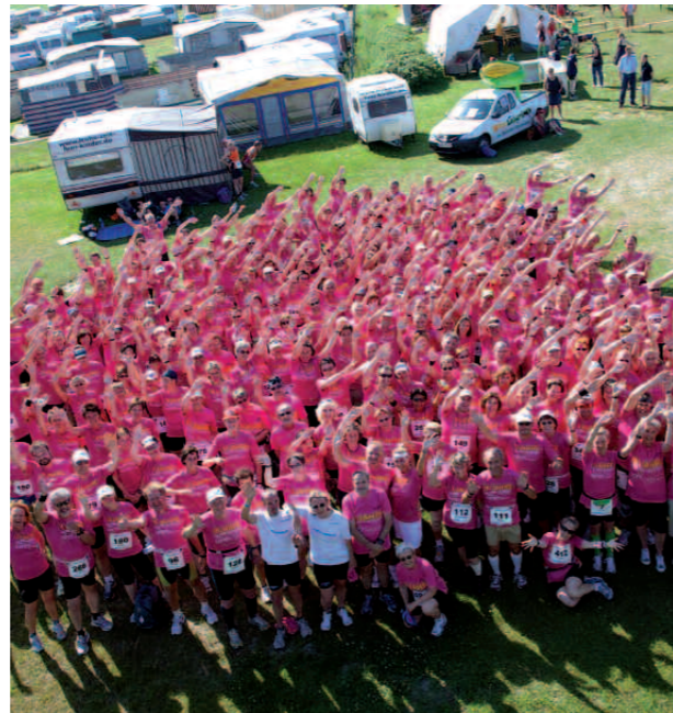
► ... der sollte sich zuvor gut aufgewärmt haben