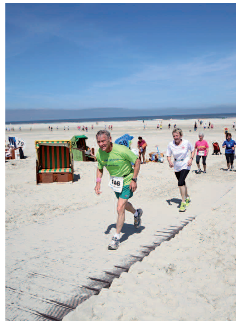
► Beim Nordseelauf machen die Teilnehmer auch die Erfahrung des kräftezehrenden Laufens auf Sand